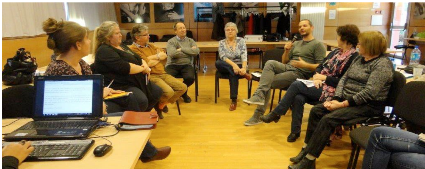
Les associations bretonnes de malentendants se sont réunies le 22 novembre 2015 à Saint Brieuc